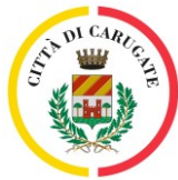
città di Carugate

con la collaborazione ed il sostegno di: