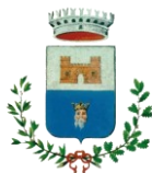
comune di Locate di Triulzi