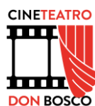
CineTeatro Don Bosco